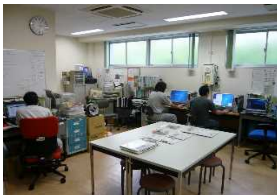
教育研究支援センター