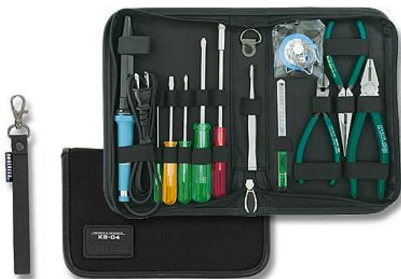
写真は仕様変更前の KS-04